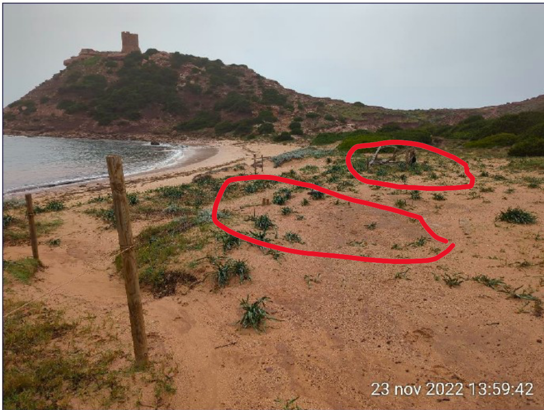
Immagine della spiaggia in cui non sono presenti i manufatti come richiesto al punto 6 – 23 novembre 2022

In merito al punto 7 gli interventi sono conformi a quanto previsto.